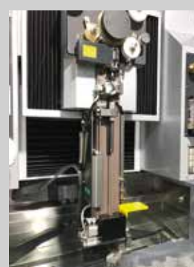
Nytt trådträdningsystem i Sodicks AL-Serien.