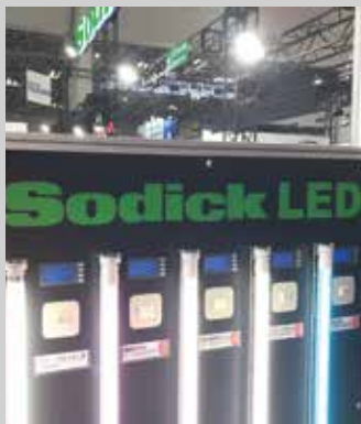
Sodick tillverkar även LED-moduler. De finns just nu som lysrör och strålkastare.